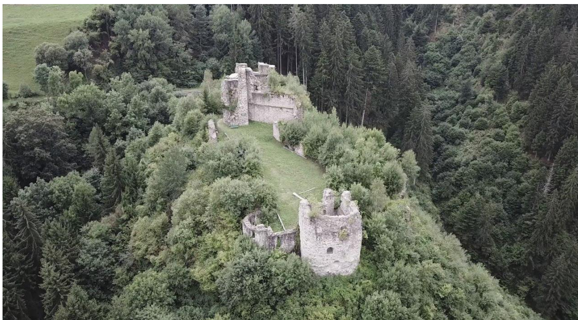
Slika 1: Ruševine gradu Ortenburg.

Okolica Špitala - matično ozemlje Ortenburžanov, predstavlja območje, od kjer so omenjeni fevdalni lastniki na do takrat še nenaseljene predele Ribniškega in Kočevskega območja naselili svoje podložnike. Na mestu nekdanjega gradu so danes le še ruševine, vendar pa se iz gradu odpira lep pogled na Dravsko dolino, na samem gradu pa je tudi obeležje, ki označuje izvorno območje naselitve Kočevarjev.