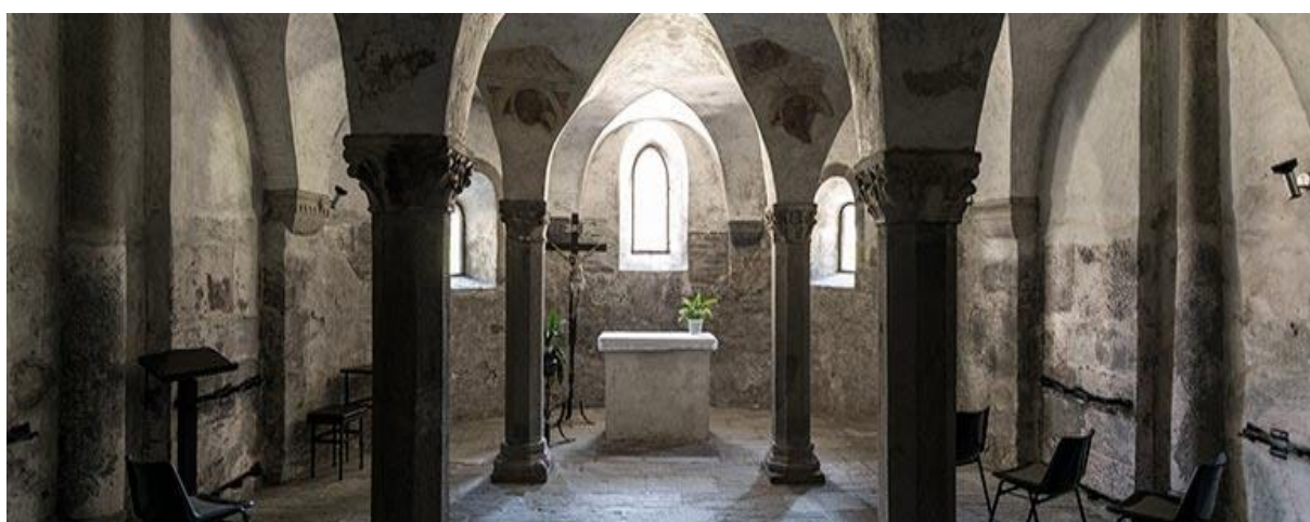
Slika 3: Kripta v Štiftni cerkvi.