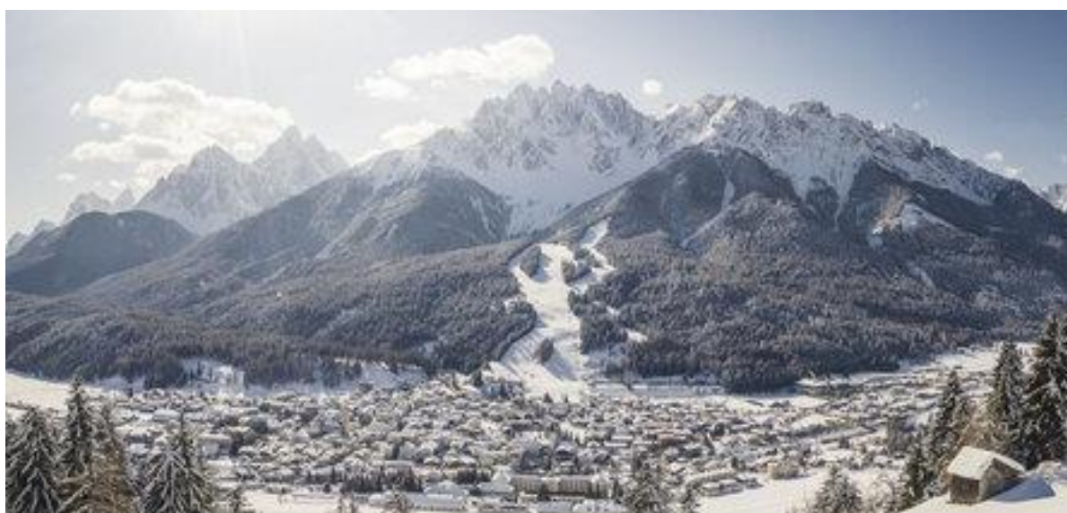
Slika 2: Innichen.

Prav tako pa si bomo ogledali eno najlepših romanskih cerkva v alpskem prostoru, ki je igrala tudi pomembno vlogo pri pokristjanjevanju Slovanov ter še danes služi kot prostor združevanja obeh kultur. Po sprehodu sledi nastanitve v hotelu, za tem pa še večerja, po želji pa še večerni sprehod po mestecu z možnostjo nakupa spominkov.